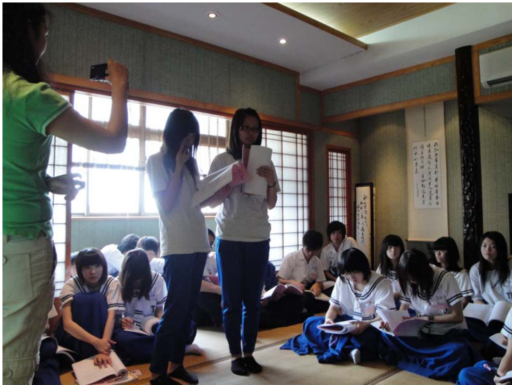
學生互相用英文對話