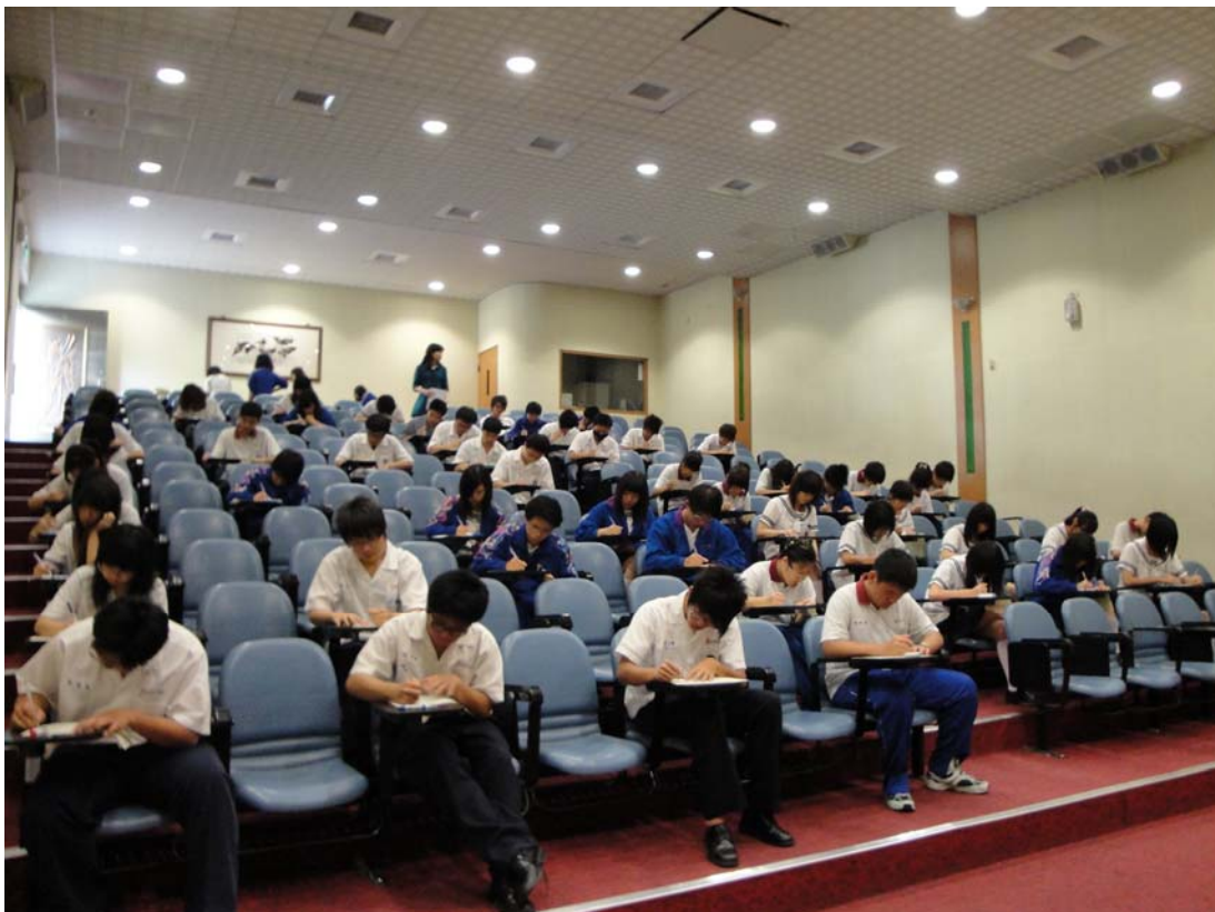
一年級學生認真作答