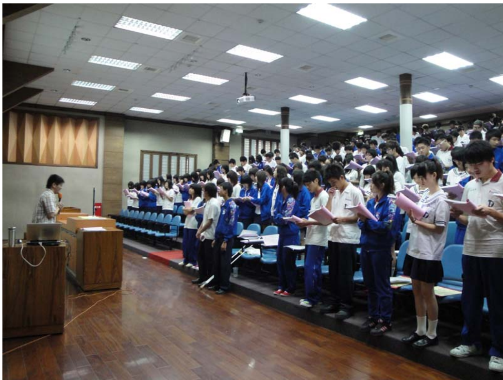
參加同學演唱一次