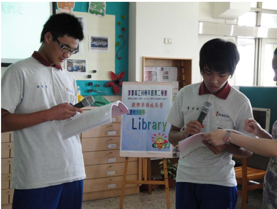
學生互相用英文對話