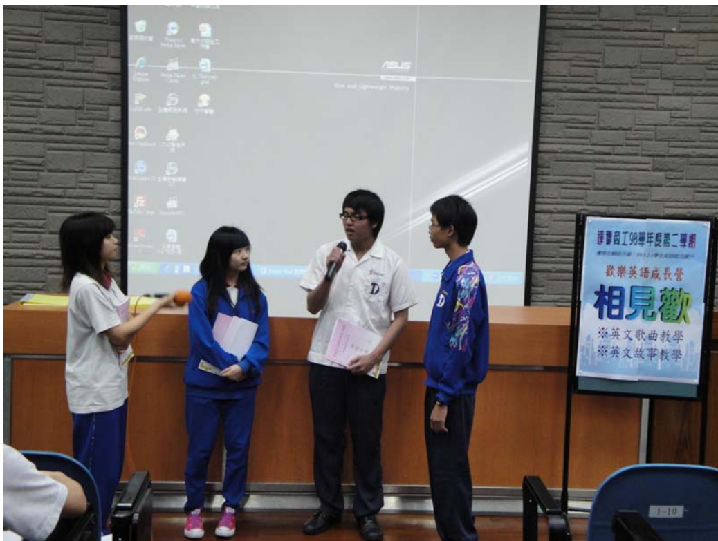
學生故事情境表演