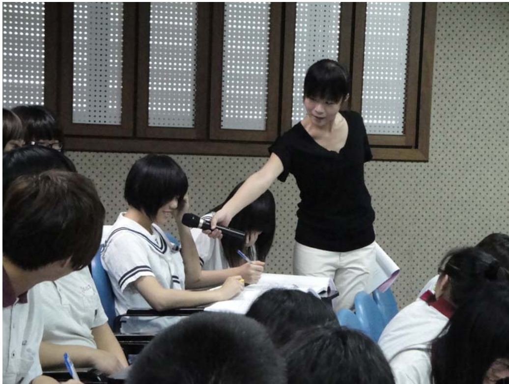
雅茜老師與學生對話