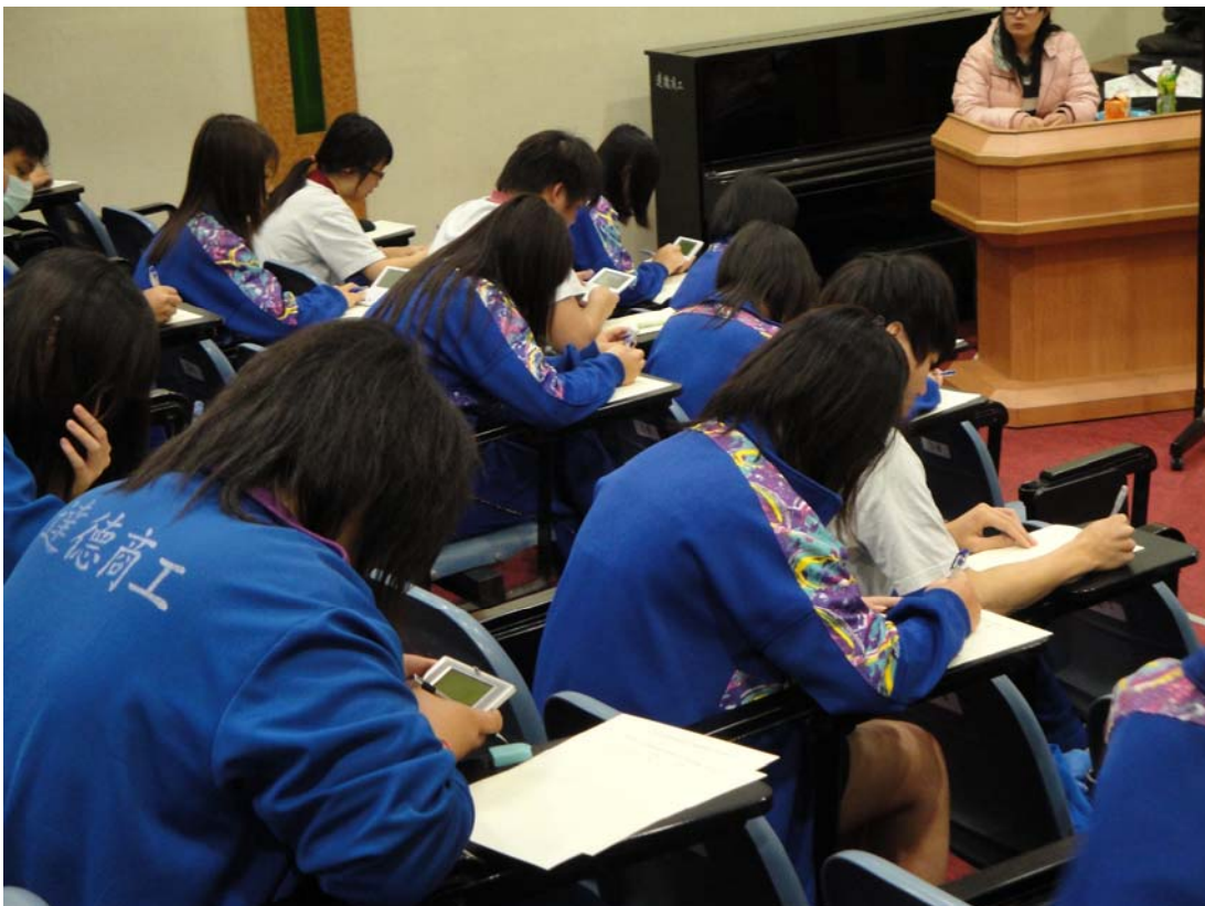
三年級學生使用電子辭典認真寫作