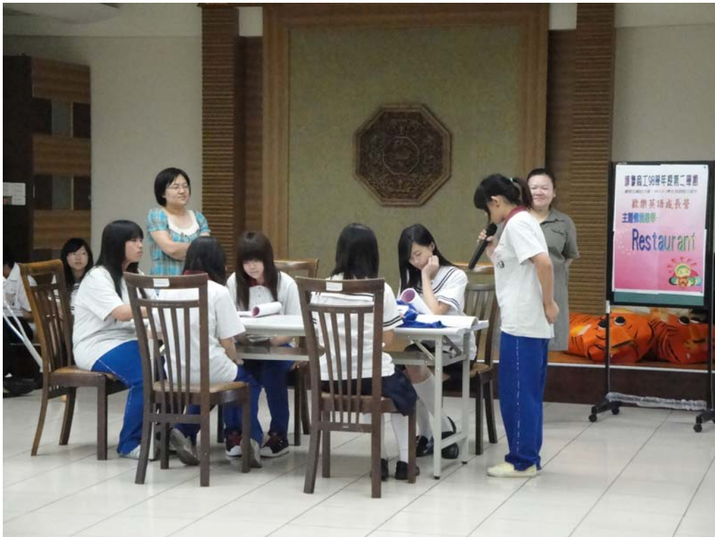
學生情境演練一邊